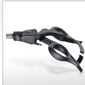
Manopla ERAGON axial com trava, com conexão AF ..... 83930084