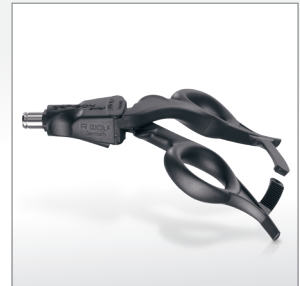
Manopla ERAGON axial com trava, não rotativa ..... 83930085