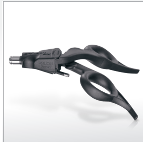
Manopla ERAGON axial sem trava, com conexão AF ..... 83930083